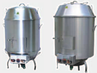
CDR-8S / CDR-9S